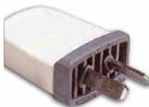
Ficha IRAM 2063 Bipolar

Sí corresponde. Toma IRAM 2071, ficha IRAM 2063 y ficha IRAM 2073