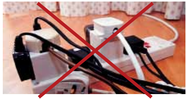
No corresponde. Conectar múltiples aparatos de una sola toma no es lo conveniente. En lugar de esto, se recomiendan las tomas móviles (zapatillas) con interruptor térmico