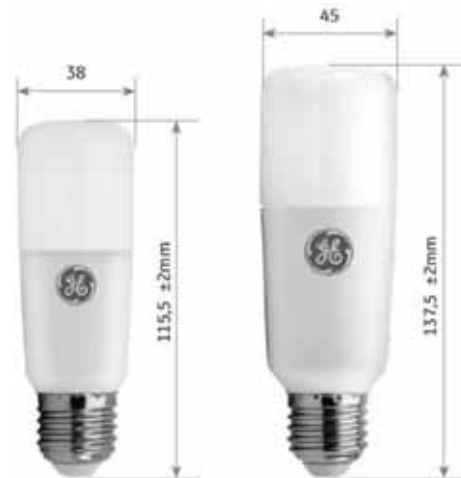
Medidas de las lámparas led

Antes de la desinstalación, la lámpara debe estar fría y se debe desconectar el suministro de energía antes de instalarla o desinstalarla. ■