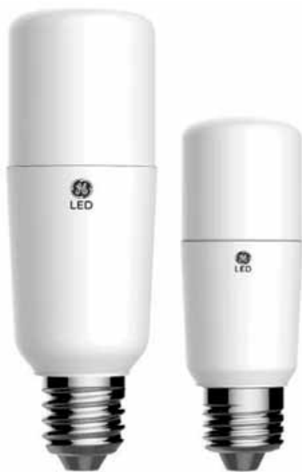
LED Bright Stik™

Con una garantía de un año, la gama se compone de cuatro modelos principales propicios para reemplazar tradicionales incandescentes de 40,