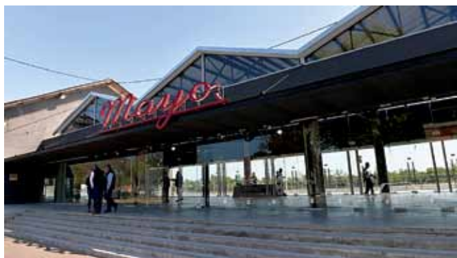
Complejo Sala Mayo

noviembre 2019, y espera contar con una sede totalmente renovada con sistemas de climatización y un auditorio con todos los avances tecnológicos a disposición.