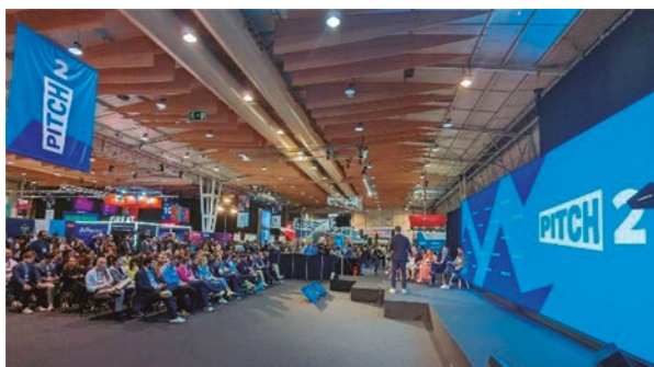
Figura 4. Uno de los tres escenarios menores destinados al Concurso de Pitches y a las presentaciones Start-Up Showcase y Growth Showcase

“sistemas de AI de alto riesgo” (ej.: los destinados a diseño biológico o los que interactúan con grandes instalaciones industriales) ya que de otra manera se podría trabar fuertemente la innovación.