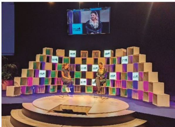
Figura 8. Escenario de Preguntas y Respuestas. El público asistente era quien realizaba las preguntas a los entrevistados. En la imagen, una Tik-Toker de EE. UU. que afirmó tener 54 millones de seguidores e ingresos de 2,5 M USD anuales.

Como gran contraste con algunos eventos que se desarrollan en nuestro país, debo mencionar que incluso al final de cada día los baños estaban impecablemente limpios.