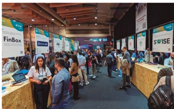
Figura 5. Puestos de exposición para las empresas Start-Up. En total, había unos seiscientos lugares y cada día se renovaban las empresas expositoras. Según su grado de desarrollo estas empresas estaban clasificadas como Alpha, Beta y Growth.

Otro de los temas centrales fue la disyuntiva “privacidad vs. seguridad” en lo que se refiere a la cantidad de información que están recolectando y analizando en tiempo real los gobiernos, las grandes empresas de Internet y ciertos sectores