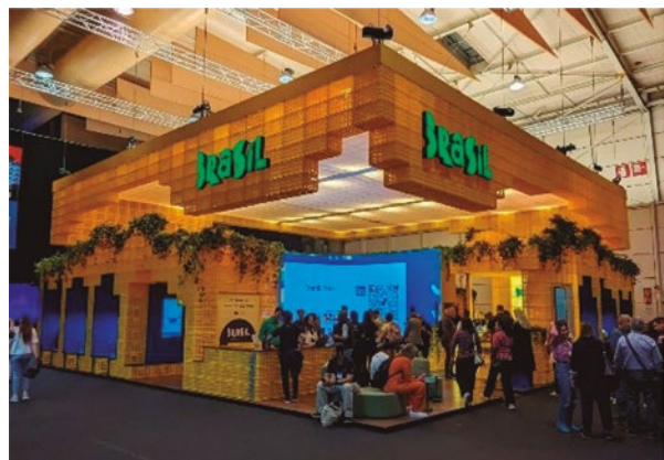
Figura 7. Algunas de las organizaciones asociadas se presentaron con grandes stands. Esta categoría está mayormente reservada a países, regiones y empresas relevantes. En la imagen, el stand de Brasil, casi seguramente el más concurrido de la muestra.

Posiblemente, debido a la controversia que rodeó a la renuncia del CEO original, el nivel de seguridad era bastante elevado; con una inspección cuidadosa de todas las personas que ingresaban al predio ferial.