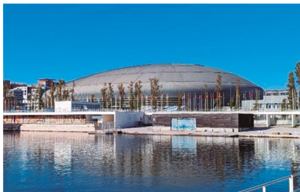
Figura 1. Exterior del estadio perteneciente al Predio Ferial de Lisboa, en donde se desarrollaron las sesiones principales