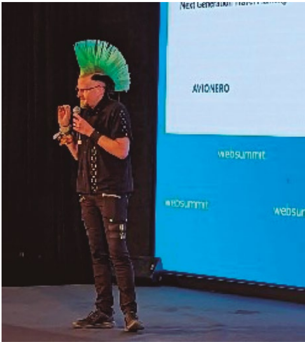
Figura 6. Varios de los disertantes mostraron una imagen poco convencional.