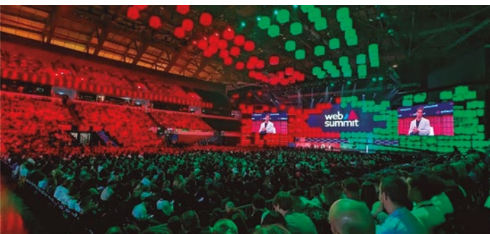
Figura 2. Vista general del acto de inauguración

La realidad es que el tono de ese mensaje no difería demasiado con lo que han expresado algunos jefes de gobierno de países occidentales. El problema se originó cuando esa opinión fue clasificada como “declaración ultrajante” por el embajador de Israel en Portugal y eso ocasionó una avalancha de deserciones. Las más notorias fueron las de empresas tales como Google, Meta (ex-Facebook), Siemens, Amazon e Intel. A fin de contener el daño, se nombró a una nueva CEO pero eso no revirtió la decisión de las grandes firmas.