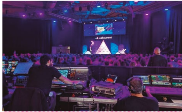
Figura 3. Uno de los diez escenarios secundarios en donde se entrevistó a personajes relevantes de la industria. Casi todas estas sesiones se desarrollaron con capacidad completa y muchos asistentes de pie.

No quiero entrar en polémicas, pero la realidad es que toda esta controversia fue bastante fogueada por algunos medios de comunicación muy leídos en la zona del Silicon Valley, tal vez algo celosos por la envergadura que tiene la WS.