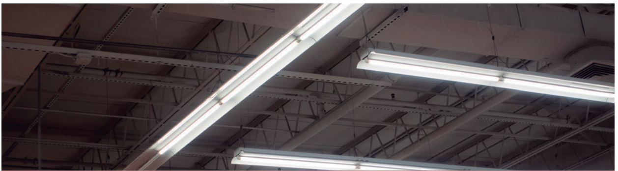
Las luminarias con lámparas de descarga gaseosas producen un parpadeo no perceptible que apareja un efecto negativo, generando fatiga y molestias

Pensar una iluminación centrada en el ser humano que imite los patrones naturales de luz, optimizar el rendimiento visual y la experiencia subjetiva bajo diferentes condiciones es la manera de preservar la salud visual, física y emocional. Es el camino hacia el que va el mundo en materia de iluminación responsable, y en Argentina existe la tecnología y la capacidad para continuar con la transición hacia una iluminación más eficiente en cada espacio. ■